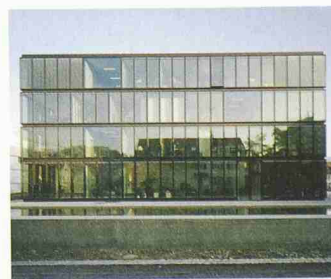
Gemeindezentrum Reinach, Wettbewerb 1997 / Realisation 1998–2002, Mst. 1:1000 (Morger & Degelo)