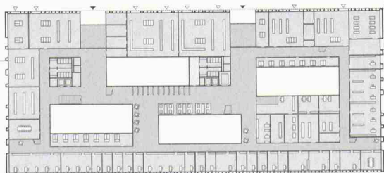
Wettbewerb Hochschule Wädenswil, August 2001, Mst. 1:1500 (Froelich & Hsu)