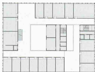
Wettbewerb Gemeindehaus Freienbach, Februar 2003, Mst. 1:1000 (Bruno Thoma)