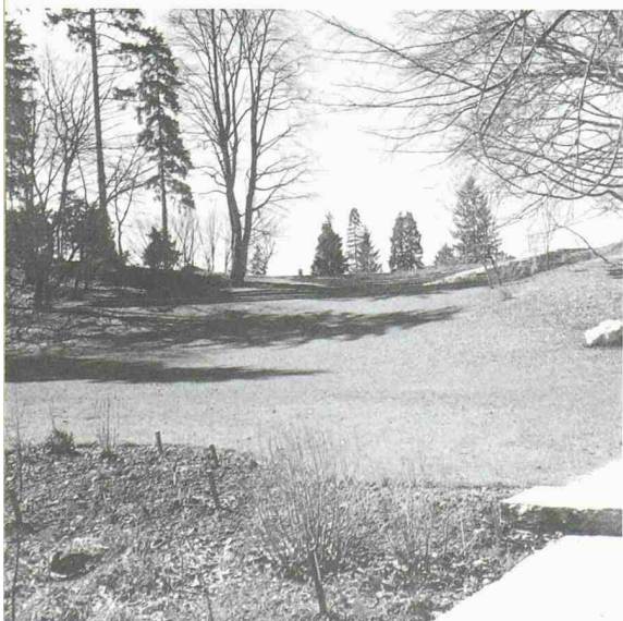
Friedhof Eichbühl und Botanischer Garten in Zürich. Ihr Schöpfer Fred Eicher erhält vom Schweizer Heimatschutz für sein Lebenswerk den Schulthess-Gartenpreis 2004