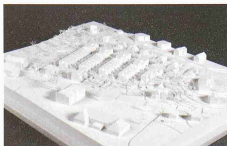
Fünf Zeilen mit Reiheneinfamilienhäusern und Wohnungen (Beat Rothen)