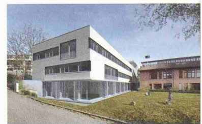
Siegerprojekt des Gesamtleitungswettbewerbs für die Erweiterung der Heilpädagogischen Sonderschule (Weiterbearbeitung, Dahinden und Heim)