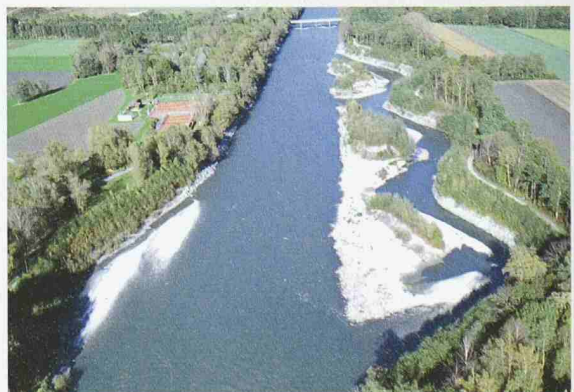
Aufweitung des Alpenrheins bei Felsberg, Chur

Zur Ausstellung erschien ein Buch, ca. 140 Seiten, etwa 300 Abbildungen, broschiert, 25 Fr., ISBN 37266 00647, erhältlich beim Stäubli Verlag, Tel. 043 433 40 40.