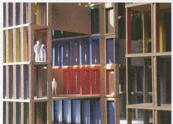
Burkard, Meyer Architekten, Baden. Schule für Berufsbildung, Baden, 2003–2006, Modellfoto