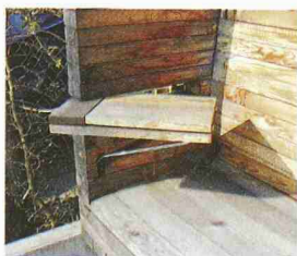
Ein Badehäuschen à la Strandkorb hat Philip Lutz 2000 in Lindau am Bodensee geschaffen: mit charmanten Details und präzisiertem Schreinerhandwerk