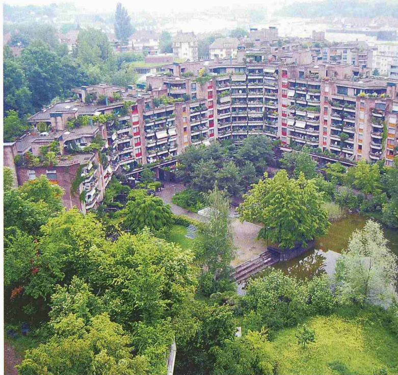
Stadt oder Land? Die Wohnüberbauung Üetlihof in Zürich verfügt seit ihrem Bau in den Siebzigerjahren über Wald, Wiese und Weiher

Da die menschliche Bevölkerung zahlenmässig kaum rückläufig sein