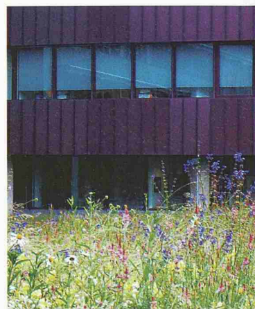
Magerwiese im Bankensektor: Die Credit Suisse Üetlihof unterhält ausgedehnte Grünflächen, begrünte Dächer und Atrien. Diese brachten ihr 1993 den Grünpreis der Stadt Zürich und 1998 den Preis der Stiftung Natur & Wirtschaft ein (Landschaftsarchitekten: Atelier Stern & Partner, E. Badaje; Bild: Grün Stadt Zürich)

Quellen: Tagungsberichte «GrünForum» (Verbund Lebensraum Zürich), «Natur findet Stadt» (Grün Stadt Zürich, Stiftung Natur und Wirtschaft), «Die begrünte Stadt» (Fachvereinigung Gebäudebegrünung; Hochschule Wädenswil), «Natur im Siedlungsraum» (Vereinigung für Landesplanung)