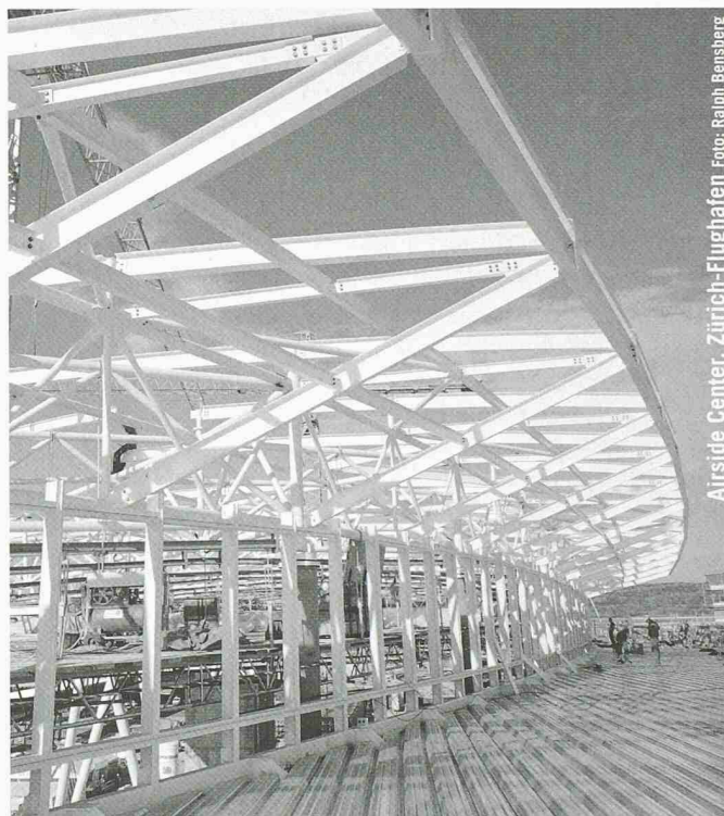
Airside Center, Zürich-Flughafen

Erwartungen über die Geschäftslage in den nächsten 6 Monaten (in Klammern Vorquartal)