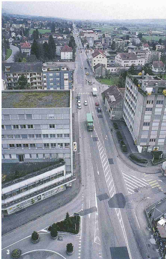
3 Vorher: Blick nach Osten auf die stark belastete Solothurnstrasse. Die Verlagerung des Transitverkehrs auf die neu eröffnete N5 ermöglichte ihren Rückbau