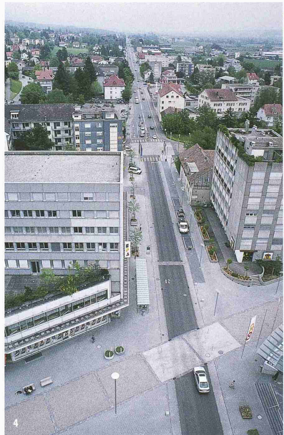
4 Nachher: Das Verkehrsaufkommen auf der ehemaligen Transitachse hat sich um zwei Drittel reduziert. Sie ist (auf dem zentralen Abschnitt) zu einer Flaniermeile mit Vortritt für die Fussgänger geworden. Die Fahrbahn ist optisch 4.50 m schmal, musste allerdings auf dem vollen Kantonsstrassenquerschnitt (7.50 m) frei von Hindernissen bleiben. Unten im Bild die durch den Belagswechsel hervorgehobene Querung