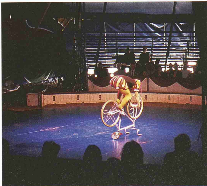
Das hoch stehende artistische Niveau des Circus Monti begeisterte die Gäste der SIA-Gala in Zürich

(Auszug aus der Begrüssung von Daniel Kündig, Präsident SIA, an der Gala-Vorstellung des Circus Monti vom 30. September für ehrenamtlich Tätige im SIA.)