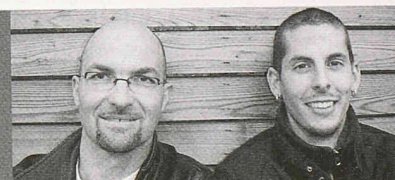
Giorgio Ceresa SA Dongio/TI, Schweiz

"LIGNATUR – il partner ideale per teste di legno come noi."