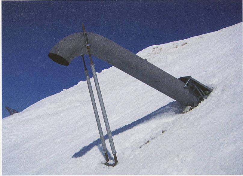
Ortsfeste Lawinensprenganlage: Sprengmast Wyssen auf der Engstligenalp bei Adelboden. Die Ladung wird an einem Seil vom Magazinkasten abgeworfen und detoniert über der Schneedecke