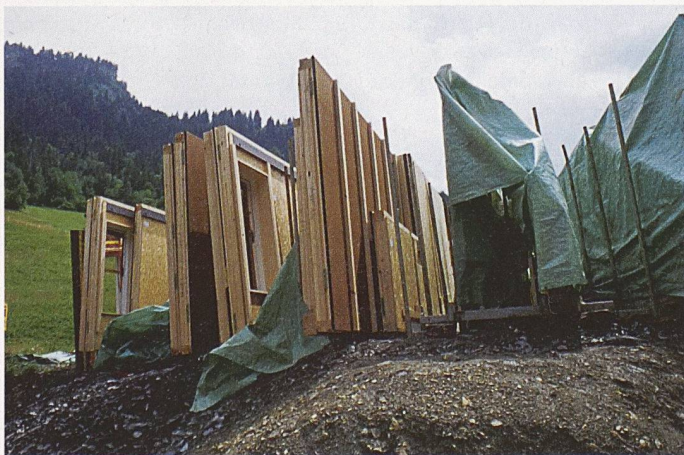
Aus diesen vorgefertigten Elementen wurde das Willimann-Haus (1998–1999) von Bearth & Deplazes in Sevgein GR gebaut

(sda/dpa/km) Das höchste Bürogebäude Frankreichs, der 210 m hohe Tour Montparnasse in Paris, ist asbestverseucht und muss vollständig saniert werden. Die entsprechenden Arbeiten in den 58 Etagen und an der Aussichtsplattform werden mit Kosten gegen 240 Mio. Euro veranschlagt. Falls der Turm für die Sanierung geschlossen wird, dauert diese etwa 3, bei Etappierung 10 Jahre.