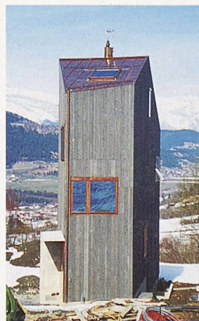
Das Willimann-Haus hat Mäusehöhlen zum Vorbild und ist deshalb höher als breit