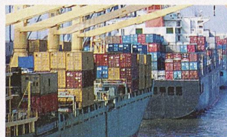
Löschern von Containerschiffen im Hafen von Hamburg

Vergangenes Jahr wurden weltweit rund 356 Mio. Standardcontainer (TEU) umgeschlagen; bis zum Jahr 2014 wird mit einer Verdoppelung dieser Menge gerechnet. Getrieben von einer weitreichenden internationalen Arbeitsteilung und dem damit einhergehenden Anstieg des Welthandels, wuchs der Containerverkehr seit 1980 jährlich um durchschnittlich 9,5%. Mit diesem Tempo kann die Infrastruktur der Häfen immer weniger mithalten. Vor allem Rotterdam, Antwerpen, Southampton und Singapur sowie die Häfen in Südkalifornien entwickeln sich immer stärker zu Engpässen. Damit sind hohe Kosten verbunden: Die Reeder müssen die Schiffe tagelang vor den Häfen warten lassen oder teure Landtransporte ab Ausweichhäfen organisieren. Da der Bau neuer Hafenterminals langwierig sei, plädieren die Autoren der Studie für die verstärkte Nutzung kleinerer und regionaler Häfen. Eine längerfristig erfolgversprechende Strategie wäre laut Experten, die Produktionsstätten wieder enger an die Konsumentenmärkte heranzuführen. Wenn sich diese Strategie durchsetzen sollte, hätte das für die Schifffahrt grosse Folgen. Investitionen der Branche könnten teilweise entwertet werden.