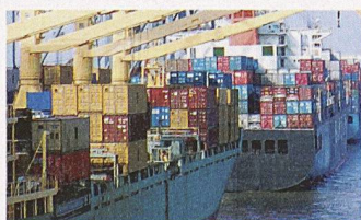
Löschern von Containerschiffen im Hafen von Hamburg

Vergangenes Jahr wurden weltweit rund 356 Mio. Standardcontainer (TEU) umgeschlagen; bis zum Jahr 2014 wird mit einer Verdoppelung dieser Menge gerechnet. Getrieben von einer weitreichenden internationalen Arbeitsteilung und dem damit einhergehenden Anstieg des Welthandels, wuchs der Containerverkehr seit 1980 jährlich um durchschnittlich 9,5%. Mit diesem Tempo kann die Infrastruktur der Häfen immer weniger mithalten. Vor allem Rotterdam, Antwerpen, Southampton und Singapur sowie die Häfen in Südkalifornien entwickeln sich immer stärker zu Engpässen. Damit sind hohe Kosten verbunden: Die Reeder müssen die Schiffe tagelang vor den Häfen warten lassen oder teure Landtransporte ab Ausweichhäfen organisieren. Da der Bau neuer Hafenterminals langwierig sei, plädieren die Autoren der Studie für die verstärkte Nutzung kleinerer und regionaler Häfen. Eine längerfristig erfolgversprechende Strategie wäre laut Experten, die Produktionsstätten wieder enger an die Konsumentenmärkte heranzuführen. Wenn sich diese Strategie durchsetzen sollte, hätte das für die Schifffahrt grosse Folgen. Investitionen der Branche könnten teilweise entwertet werden.