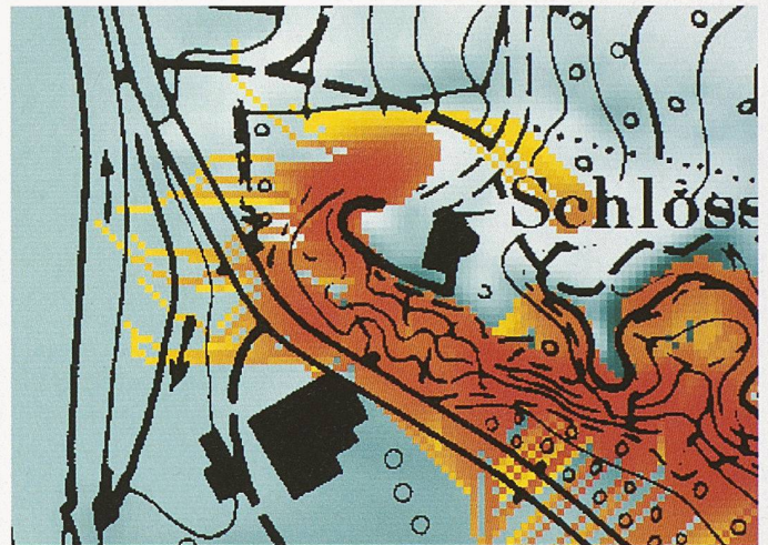
Geodaten wie Höhenmodelle, Bodenbedeckung und Verkehrsachsen als Grundlage für die Darstellung einer Steinschlagsituation

Im August 1998 beschloss der Bundesrat die Koordination der Geoinformation innerhalb der Bundesverwaltung. Deshalb setzte er unter dem Vorsitz der Swisstopo die Interdepartementale Koordinationsgruppe GI&GIS (GKG-KOGIS) ein. Im Juni 2003 beschloss er den Aufbau der Nationalen Geodaten-Infrastruktur unter Einbezug der Kantone, der Gemeinden und der Privatwirtschaft. Zur Regelung der rechtlichen Situation bei der Beschaffung und Bewirtschaftung der Daten schuf eine Arbeitsgruppe unter Leitung der Swisstopo einen ersten Entwurf für ein Bundesgesetz über die Geoinformation (GeolG) und gab diesen im Frühjahr 2004 in eine informelle Konsultation. Dazu nahm auch die Berufsgruppe Boden / Wasser / Luft im Namen des SIA Stellung. Der Entwurf führt u. a. den Begriff Geobasisdaten ein. Vorgesehen ist, dieses Gesetz auf den 1. Januar 2008 in Kraft zu setzen. Im Herbst 2005 findet die offizielle Vernehmlassung statt.