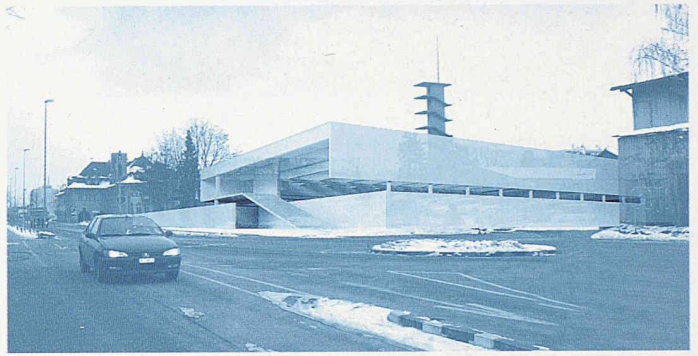
Die Eingangssituation mit der gedeckten Aussentreppe (1. Rang, GXM Architekten)

Vorschlag nach Meinung von Projektleiter Christian Stucki, weil er ein volumetrisch schönes Ensemble bildet. Um den Schlauchturm gruppieren sich die zwei bestehenden Bauten aus den 1960er-Jahren und die zwei neuen liegenden Volumen. Mit der umgebenden Mauer ist der Block auch schön abgeschlossen. Gleichzeitig rechnen die Veranstalter mit einer wirtschaftlichen Lösung.