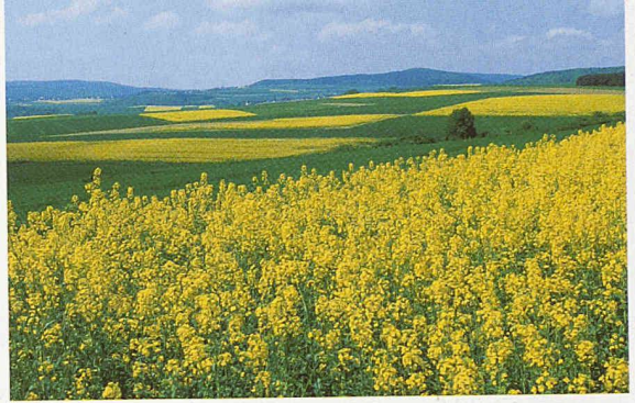
Raps mit Zukunft: Dank neuem Verfahren kann daraus kälteresistentes Schmieröl hergestellt werden

Auf www.wasserqualitaet.ch können die Trinkwasserdaten entweder nach Postleitzahl oder Wohnort abgerufen werden. Da die Beteiligung an dem Dienst fakultativ ist, sind noch nicht alle Wasserversorger eingetragen.