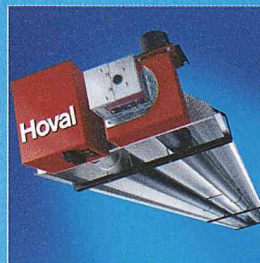
WeilRad. Die Strahlungsheizung für grosse Räume.

Sie integrieren sich unauffällig in Einkaufszentren und Messehallen. Sie beheizen gezielt Teilbereiche in Werkhallen. Sie sparen Energie durch Abbau der Temperaturschichtung. Sie fördern Produktivität mit idealen Arbeitsbedingungen. Die Hoval Hallenklima-Systeme schaffen den Sprung, auch wenn Sie die Messlatte hoch legen. Möchten Sie erfahren, weshalb Betreiber, Planer und Installateure in mehr als 25 Ländern auf Hoval Know-how vertrauen, wenn es um das Lüften, Heizen und Kühlen von Hallen geht? Dann verlangen Sie Unterlagen bei: Hoval Herzog AG, Lufttechnik, Postfach, 8706 Feldmeilen, Tel. 044 925 61 11, Fax 044 923 11 39, info@hoval.ch , www.hoval.ch .