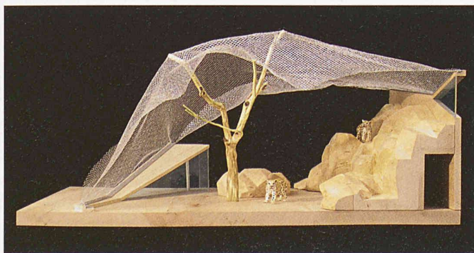
Ein Metallgitter spannt sich über die aus Burgerwäldern herbeigeschafften, ganzen Eichenbäume (1. Rang, Weber + Brönnimann / Graber-Pulver)