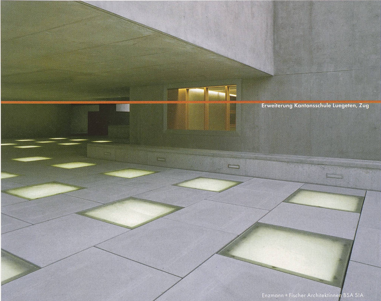
Erweiterung Kantonsschule Luegeten, Zug

Enzmann + Fischer Architektinnen BSA SIA