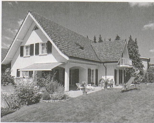
Kinderspielplatz: Eine in die Erde verlegte Tankanlage lässt viel Raum.

Die reine Heizungserneuerung dauert bei guter Vorbereitung nur wenige Tage. Im Normalfall werden Kessel, Brenner und die Steuerung/Regelung durch eine moderne Kompaktwärmezentrale ersetzt. Die Erneuerung kann auch in der kalten Jahreszeit zu erfolgen, da bereits nach einem Tag wieder geheizt werden kann. Weil moderne Heizsysteme mit niedrigen Abgastemperaturen arbeiten, muss wegen der Kondensation der Abgase ein neues Kaminrohr installiert werden. Verfügt jedoch die neue Heizanlage über einen Brennwertkessel, genügt lediglich ein Kunststoffrohr zur Abgasableitung. Wer sich rechtzeitig mit der Sanierung seiner Heizung befasst und die alte Ölheizung durch eine neue ersetzt, kann sich also nicht nur Hektik und Umbaustress ersparen, sondern auch in Zukunft mit der Gewissheit leben, kein unnötiges Geld zu verheizen.