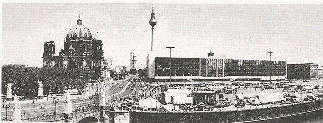
Oben: Das Berliner Schloss vor seiner Zerstörung 1945/1950. Unten: Der Palast der Republik nach seiner Errichtung 1976