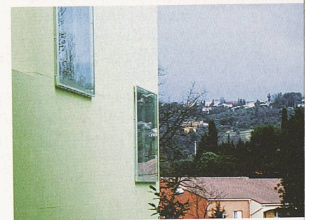
Der «Espace» im Kontext des Städtchens