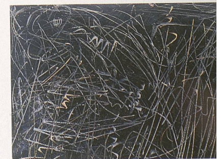
Die «Kratzspuren» – gesehen von Harald F. Müller – in Imi Knoebels «Schlachtenbild» (1990).