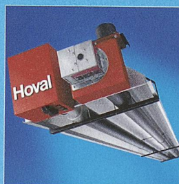
WeilRad. Die Strahlungsheizung für grosse Räume.

Sie integrieren sich unauffällig in Einkaufszentren und Messehallen. Sie beheizen gezielt Teilbereiche in Werkhallen. Sie sparen Energie durch Abbau der Temperaturschichtung. Sie fördern Produktivität mit idealen Arbeitsbedingungen. Die Hoval Hallenklima-Systeme schaffen den Sprung, auch wenn Sie die Messlatte hoch legen.