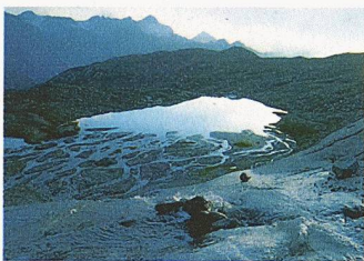
Der Silvrettagletscher soll bald einen Naturlehrpfad erhalten