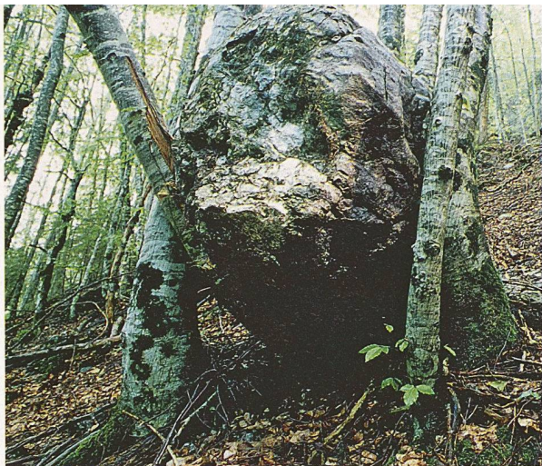
Effektiver Schutz vor Steinschlag