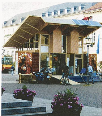
Experiment-Sonnenhaus aus Materialien wie Strohballen, Holz oder Glas