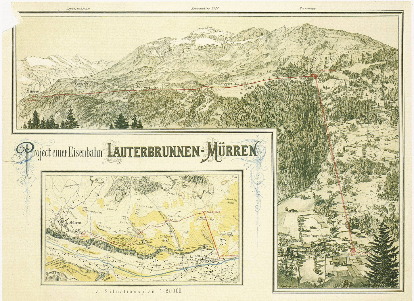
Vorstudie zur Erschliessung Mürrens mit Standseil- und Adhäsionsbahn von Ingenieur X. Imfeld aus dem Archiv der Schweizerischen Bauzeitung

(pd/rw) Die Standseilbahn Lauterbrunnen–Grütschalp im Berner Oberland soll durch eine Luftseilbahn ersetzt werden. Das bis zu 60 % steile gemauerte Trasse liegt in einem Rutschhang und hat sich seit der Eröffnung der Bahn 1891 um 2.5 m seitwärts und 3 m talwärts verschoben. Nach erneuten gravierenden Schäden im vergangenen Winter hat das Bundesamt für Verkehr die Betriebsbewilligung bis Juli 2006 befristet. Die Standseilbahn mit der anschließenden Adhäsions-Schmalspurbahn Grütschalp–Mürren ist neben der Luftseilbahn Stechelberg–Mürren