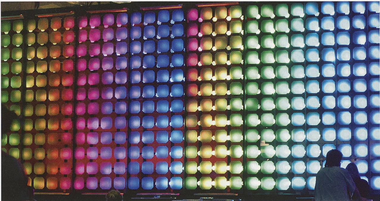
Licht in allen Erscheinungsformen verzaubert die Welt und zieht Menschen stets von Neuem in den Bann