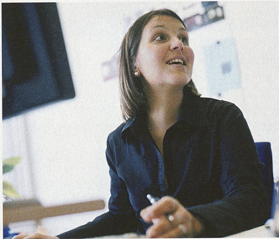
Ingenieurberufe haben Zukunft