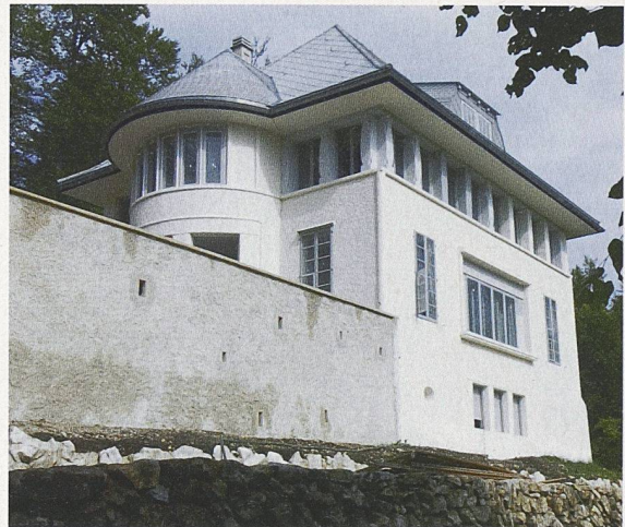
La Maison blanche (Villa Jeanneret-Perret) von Le Corbusier in La Chaux-de-Fonds (Bilder: FLC/Pro Litteris / E. Perroud)

gen wurden nicht rückgängig gemacht. Doch wurden die dem ursprünglichen Zustand entsprechenden Materialien und Farben für den Verputz, die Dachhaut, die Wand- und Bodenbeläge wiederhergestellt. Historisches Mobiliar, darunter das originale Sofa, ergänzt diese Wiederherstellung und gibt die aus Fotografien bekannte Stimmung einiger Wohnräume aus der Zeit der Familie Jeanneret wieder.