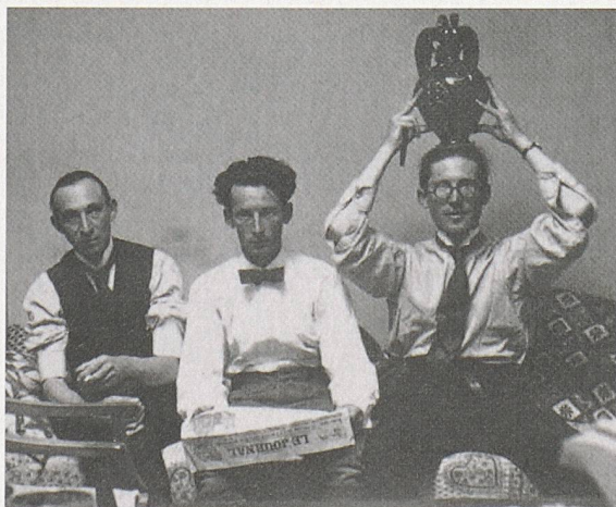
Amadé Ozenfant und die Brüder Albert und Charles-Edouard Jeanneret (v. l. n. r.)

Bei der Restauration ging es nicht allein darum, den Ursprungszustand wiederherzustellen. Spätere, vom Architekten beschlossene oder genehmigte Anpassun-