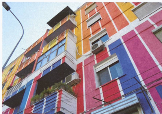
Eine triste Umgebung lebenswerter machen: Farbige Häuserfassaden in Tirana, Albanien

Arranger un environnement déprimant: façades polychromes à Tirana, en Albanie