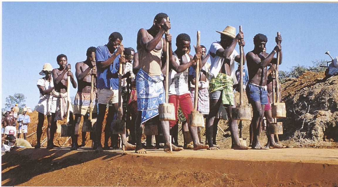
Kanalbau in Madagaskar