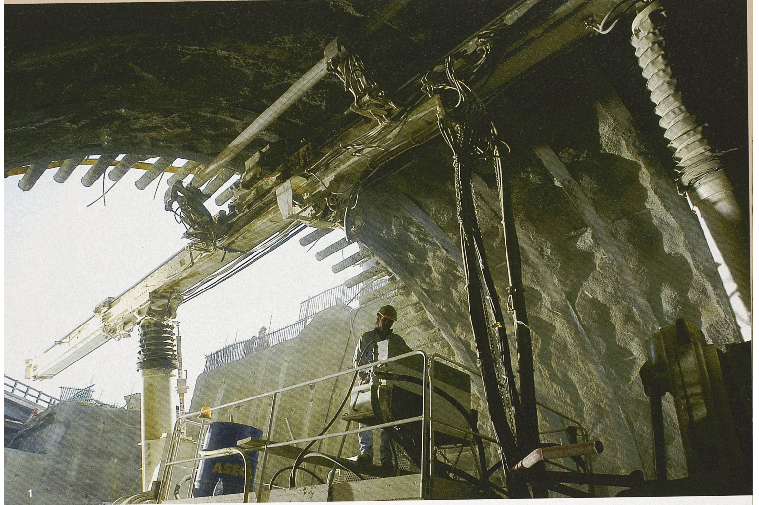
1 Sicherung mit Jetgewölbe, Stahleinbaubogen und Spritzbeton im Portal des Tunnels AR (Unterquerung des Nationalstrassenanschlusses Lausanne Epalinges), vor der Haltestelle Vennes