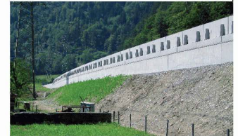
Auf der Rückseite verstärkte Lärmschutz-Elemente