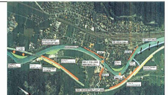
Situation, schematische Darstellung der Hochwasser-Umleitung um Erstfeld

6221 Rickenbach LU, Tel. 0848 200 210, www.ms-baustoff.ch , info@ms-baustoff.ch