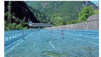
Autobahn-Fahrbahn mit Wasser im Falle der Überflutung