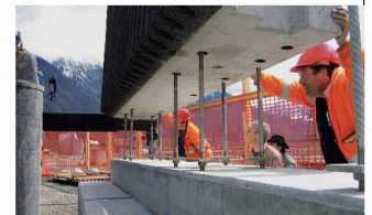
Millimetergenau aufeinander abgestimmtes Montagesystem