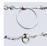
Test bestanden – der Prüfkörper hängt im Netz. Rechts: Bremsringe ziehen sich bei grosser Kräfteinwirkung zusammen

Bohren Rammen Fundationen Baugruben- abschlüsse Grundwasser- absenkungen