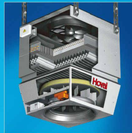
TopVent* DKV. Das Umluft-Heiz/Kühl-Gerät für hohe Hallen.