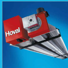
WelRad. Die Strahlungsheizung für grosse Räume.

Sie integrieren sich unauffällig in Einkaufszentren und Messehallen. Sie beheizen gezielt Teilbereiche in Werkhallen. Sie sparen Energie durch Abbau der Temperaturschichtung. Sie fördern Produktivität mit idealen Arbeitsbedingungen. Die Hoval Hallenklima-Systeme schaffen den Sprung, auch wenn Sie die Messlatte hoch legen.