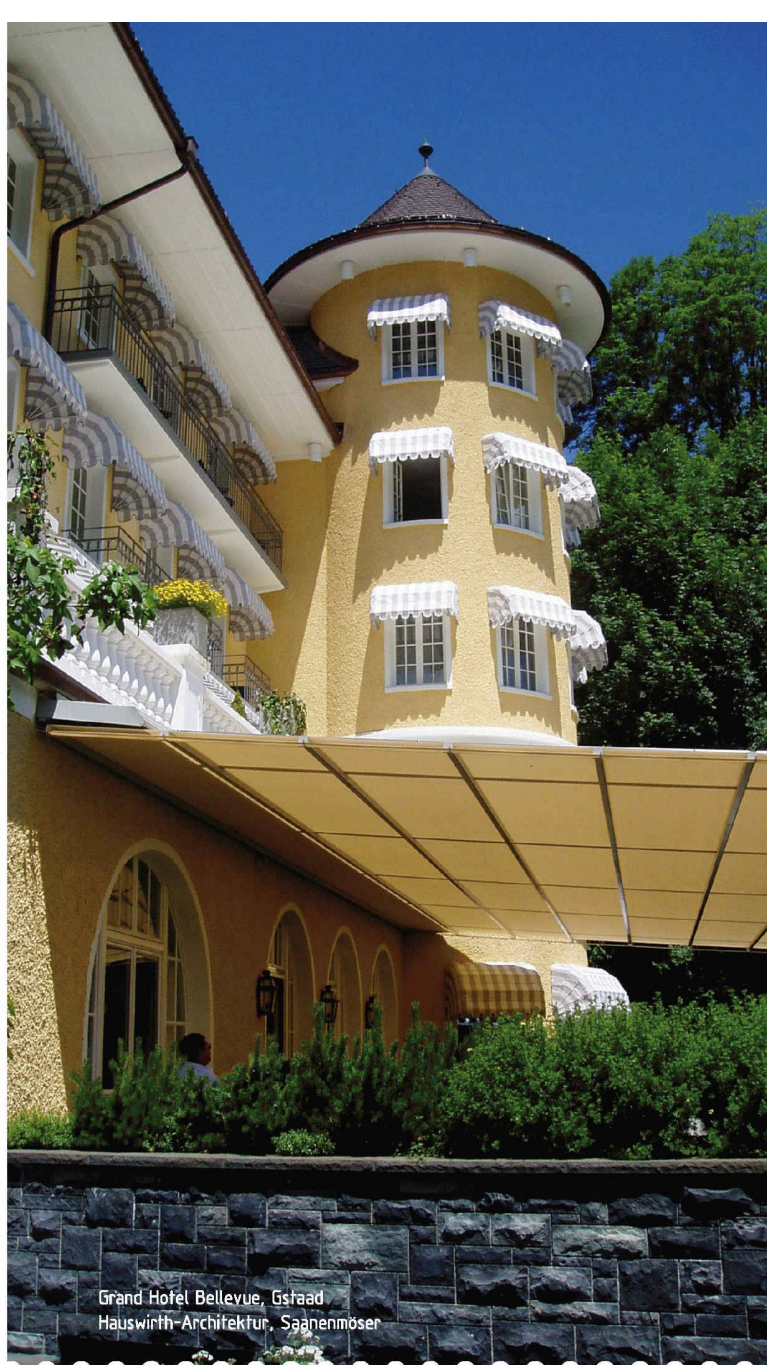
Grand Hotel Bellevue, Gstaad Hauswirth-Architektur, Spaanmöser