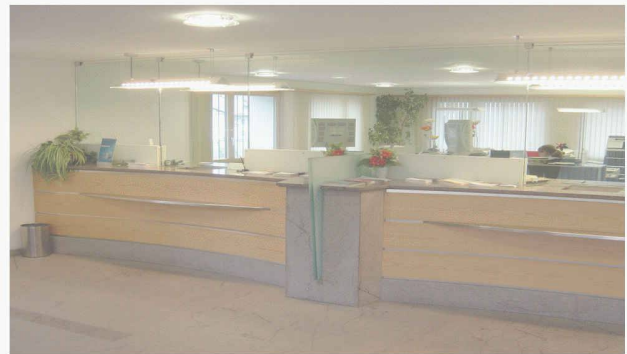
Schalteranlagen, Tresore und Safeanlagen

Quaderstrasse 7 CH-7000 Chur Tel. 081 253 61 21 Fax 081 253 61 65 Natel 079 375 81 39 simonsafe@bluewin.ch