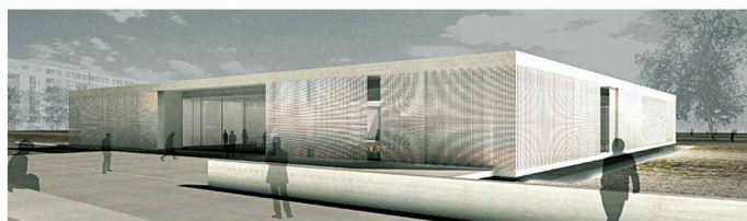
Erneuter Wettbewerb für die «Topographie des Terrors» in Berlin (1. Preis, Heinle, Wischer und Partner / Heinz W. Hallmann)