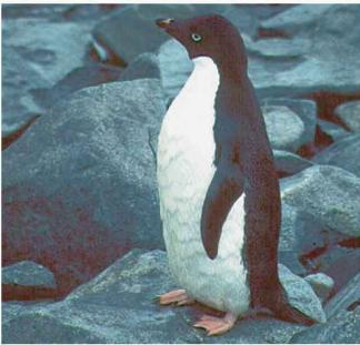
Bild oben: Der Eisberg B-15A, von der Spitze der Drygalski-Eiszunge aus fotografiert, bevor er zerbrochen ist Bild links: Ausgewachsener Adélie-Pinguin

Ursache musste also eine Blutaufrischung durch plötzlich in die Fortpflanzungsgemeinschaft eingebrochene Fremdpinguine sein. Was konnte dazu geführt haben, angesichts der bekannten Verwurzelung der Vögel mit ihrem Geburtsort?