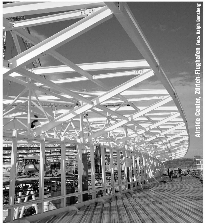
Airstide Center, Zürich-Flughafen