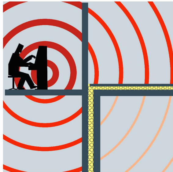
Die neue Norm und die Dokumentation Schallschutz im Hochbau entsprechen dem aktuellen Stand der Technik

Neben den Anpassungen der Anforderungen sowie den formellen Neugliederungen wurden Angleichungen an aktuelle ISO- und EN-Normen vorgenommen. Besser berücksichtigt die Norm nun die Hörwahrnehmung bei der Bewertung von Lärmstörungen. Dazu sind neu