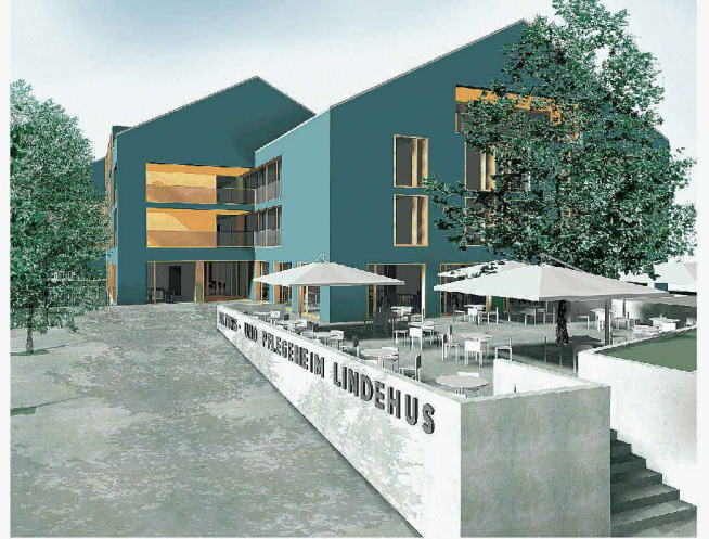
Neue Erscheinung mit angehobenen Dächern (1. Rang, Baureag Architektengruppe)