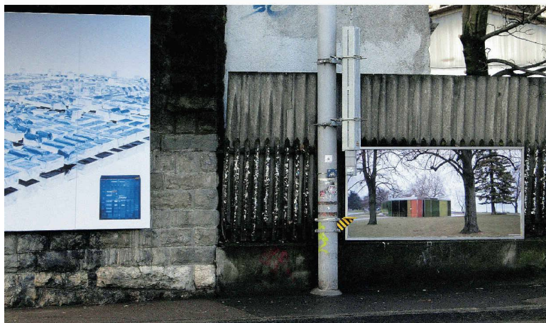
Neben der Schokoladen-Stadt sind die ausgezeichneten guten Bauten der Stadt Zürich zu sehen. Hier der Pavillon Hafen Riesbach von Andreas Fuhrmann und Gabrielle Hächler (Bild: Nicolas Contesse)

(bä) Gleich zwei Plakatkampagnen beschäftigen sich in Zürich mit «modernem» Städtebau. Da ist einmal Jean Nouvel's Schokoladen-Stadt, in der wahrscheinlich selbst hartgesottene Schachbrett-Architekten sich nicht wirklich vorstellen können zu leben. Und manchmal hängen daneben Plakate von Bauten, die sonst nur in Fachzeitschriften zu sehen sind. Es sind die 15 Bauten, die die Auszeichnung für gute Bauten in der Stadt Zürich erhalten haben. Ausser einem kleinen Hinweis auf die Website zeigen die Plakate jeweils nur ein Gebäude – kein Text, kein weiterer Hinweis stört die Aura der guten Architektur.