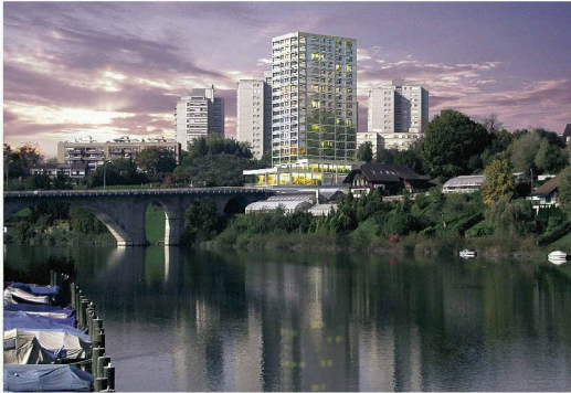
Wohnturm mit Restaurant im Erdgeschoss (Weiterbearbeitung, Bünzli & Courvoisier)

(bö) Die Gemeinde Wohlen gibt sich mutig. Zusammen mit der Moser Bau Immobilien AG, der Investorin und Grundeigentümerin, hat sie einen Studienauftrag durchführen lassen mit dem Ziel, Hinterkappelen qualitativ hoch stehend zu entwickeln. Sechs Architekturbüros konnten teilneh-