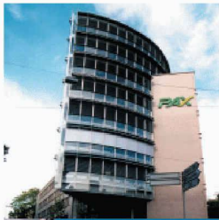
Gewerbe- und Wohnbau