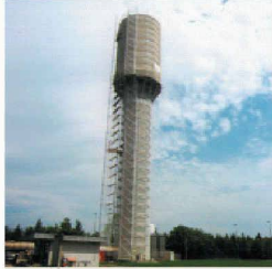
Behälter- und Bäderbau