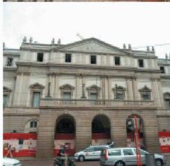
Neubauten in und an bestehenden Bauten

Durch die über 40-jährige Erfahrung und Spezialisierung auf vorbeugende und sanierende Abdichtung gegen drückendes Wasser, sowie ständige Weiterentwicklung der Produkte und Lösungen, können Sie mit RASCOR nur gewinnen.