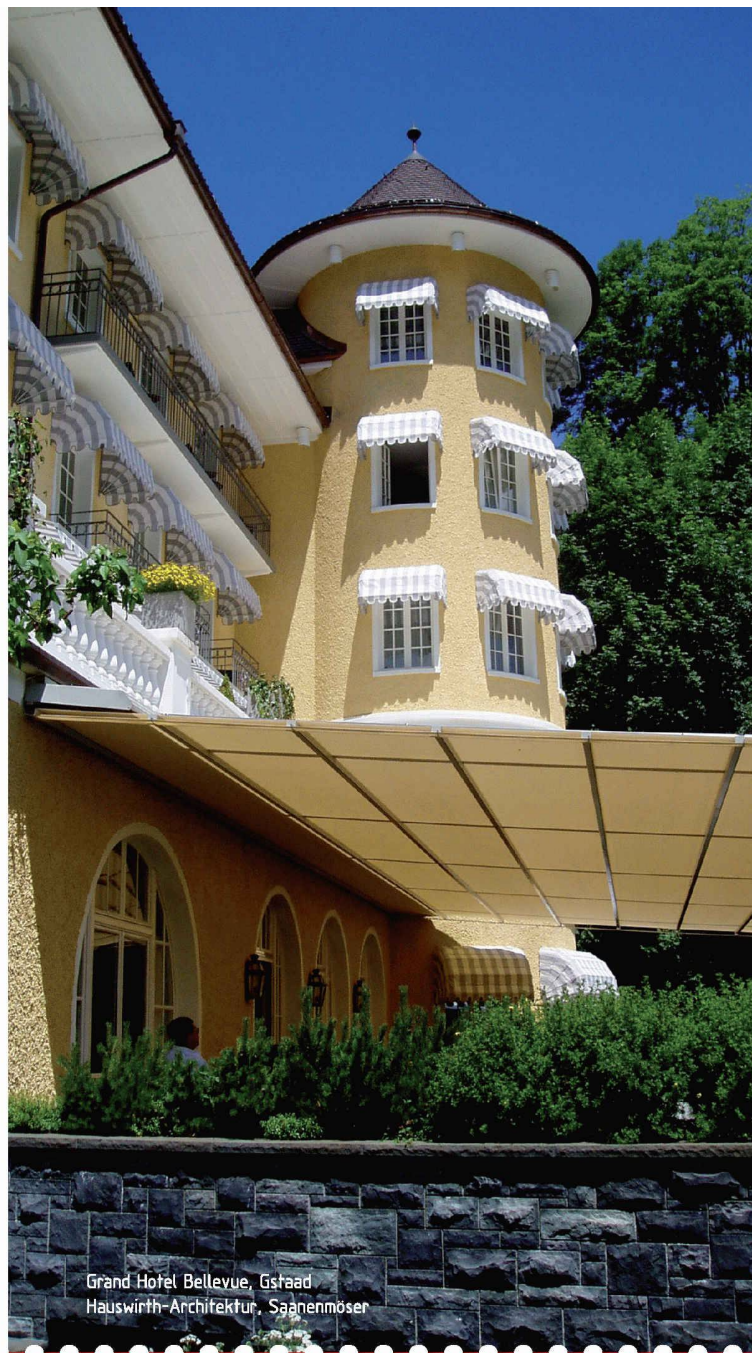
Grand Hotel Bellevue, Gstaad Hauswirth-Architektur, Saanenmöser

Henkel & Cie AG Abt. Bautechnik Tel. 0041 (0)61 / 825 72 34 Fax 0041 (0)61 / 825 74 46 consumer.adhesives@ch.henkel.com