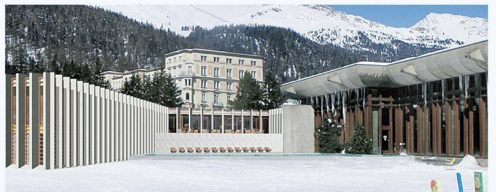
Das St. Moritzer Hallenbad aus den 1960er-Jahren soll erweitert werden. Situation und Visualisierung (Weiterbearbeitung, Christoph Sauter/Roberto Trivella)