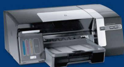
HP OfficeJet Pro K550

Von HP: Farbe, die bis 30 % weniger kostet.* Denn die Arbeit ruft.