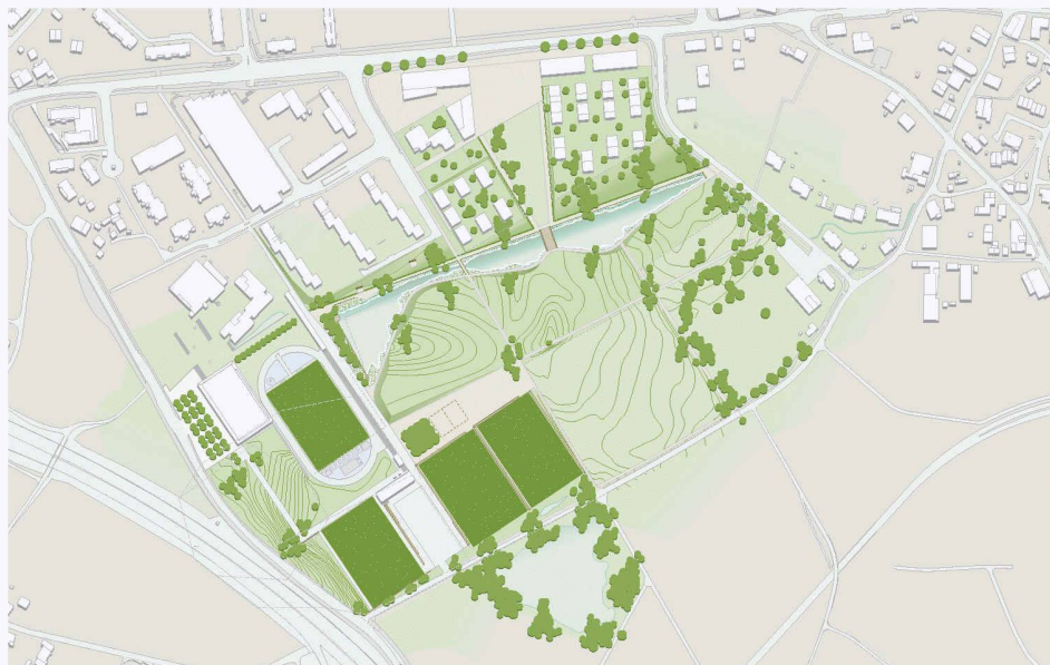
Parkanlage Gries in Volketswil (Weiterbearbeitung, asp Landschaftsarchitekten )