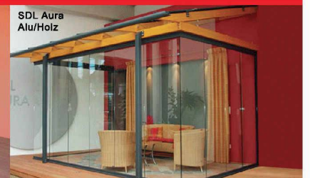
Auch in Holz/Alu!

Die neuen Terrassendächer SDL-Atrium und SDL-Aura von Solarlux überzeugen durch ihr elegantes Design und den modularen Ausbau zum Glashaus. Zudem sind die SDL Terrassendächer preislich sehr attraktiv. Verlangen Sie Unterlagen und setzen Sie auf SOLARLUX!