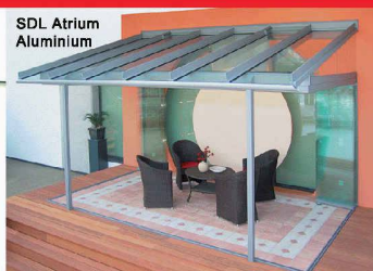
Glashaus mit SL25