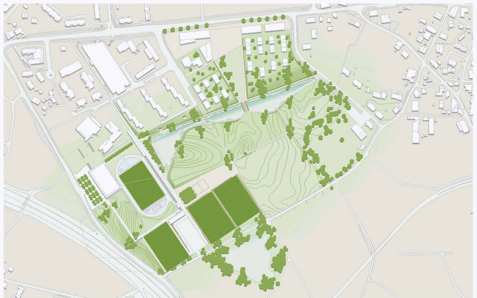
Parkanlage Gries in Volketswil (Weiterbearbeitung, asp Landschaftsarchitekten )