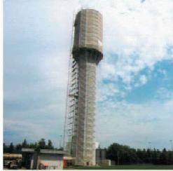
Behälter- und Bäderbau