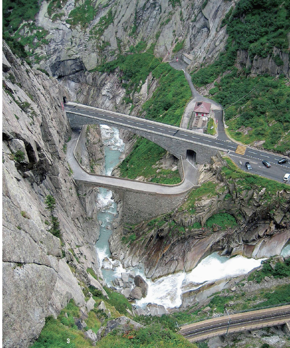
3 Wenig genutztes Potenzial für Kulturtourismus: die historische Verkehrslandschaft am Gotthard, hier die Schöllenschlucht mit Teufelsbrücke

dringend Konsensbemühungen, die die unterschiedlichen Sichtweisen zusammenführen. Weder im Gotthard-Raum noch in der Surselva wurde diese Frage angegangen. Darum werden gleichzeitig sehr unterschiedliche und sich widersprechende «Landschaftsprojekte» lanciert – beispielsweise das Nationalpark-Projekt «Parc Adula», das auf einer kantonsübergreifenden Fläche mit der Greina-Hochebene im Zentrum die vielfältige Landschaft schützen und Wertschöpfung für die anliegenden Regionen generieren soll. Gleichzeitig wird in Andermatt, das von einem ägyptischen Investor eher zufällig und ohne Bezug zur Region auserwählt wurde, ein künstliches Ferien-Resort geplant. In der Surselva entstehen drei neue Golfplätze (neben dem bereits bestehenden in Sedrun), obwohl sehr fraglich ist, ob die Nachfrage überhaupt vorhanden ist. Die Aufzählung liesse sich verlängern. Bis auf Gemeindeebene hinunter wird ein eher widersprüchlicher Einzelprojekt-Aktivismus sichtbar ohne Konsens und ohne gemeinsame und abgestimmte Strategie für die Landschaftsentwicklung.