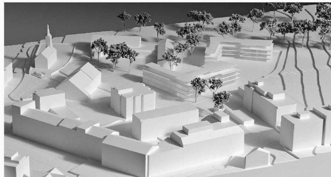
Wohnen in Schwamendingen (Weiterbearbeitung, Egli Rohr Partner)

(bö) Gleich hinter dem Schwamendingerplatz im Übergang von der Bau- zur Freihaltezone möchte die private Bauherrschaft W. Schmid AG Eigentumswohnungen erstellen. Acht Büros lud man zum anonymen Studienauftrag ein. Einstimmig wählte die Jury den Vorschlag von Egli Rohr Partner . Zwei winkelförmige Baukörper reagieren auf die unterschiedlichen städtebaulichen Bedingungen auf jeder Seite. Zusammen mit dem Kirchgemeindezentrum wird laut Jurybericht eine Raumfolge von drei ineinander verzahnten Räumen entlang des bestehenden Flurwegs gebildet. Mit 41 Wohnungen und fünf Ateliers in den Erdgeschossen bietet das Projekt die höchste Zahl an Wohnungen. Dennoch schaffe es gut nutzbare Freiräume.