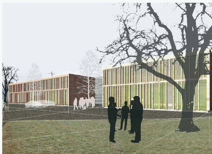
Die BSZ Stiftung will in Schübelbach ein Produktionsgebäude bauen. Aus dem Quader ist ein Eingangshof ausgeschnitten (1. Rang, Markus Boyer)