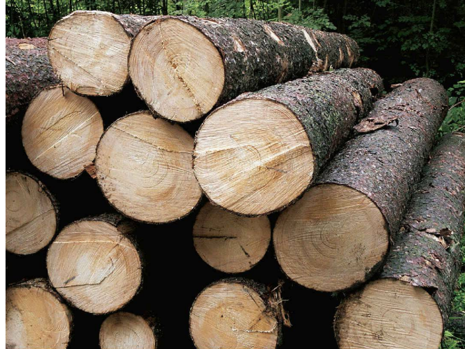
Holzpolter an der Waldstrasse: Das aufgerüstete Fichten-Rundholz liegt für den Transport in die Sägerei bereit