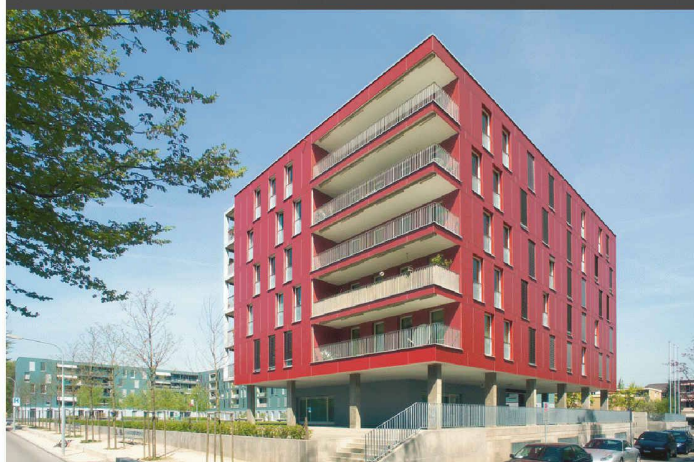
Architekten: Tina Arndt, Daniel Fleischmann, Zürich

Die Wahl des Materials als entscheidendes Element einer konsequenten Umsetzung. SWISSPEARL Faserzementplatten verleihen dem gestalterischen Konzept ein Gesicht. Mit einzigartiger Ausdruckskraft.